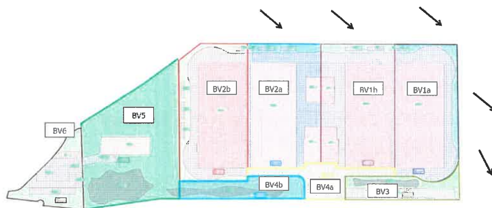
Figure 27 : Plan de découpage des bassins versants à l'échelle du projet

→ Sens d'écoulement naturel des eaux pluviales